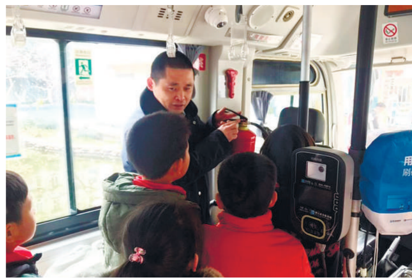
昨日,杭州公交五公司四车队的工作人员来到杭州市饮马井巷小学,为学生们带去了开学的第一堂现场教学体验课——安全教育课。