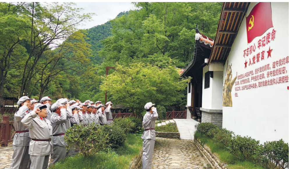
“红色之旅” 为弘扬践行“浙西南革命精神”,助推“红+绿”融合发展,景宁县总工会积极打造“红色之旅”职工疗休养线路。近日,由丽水市总工会组织的劳模及一线(优秀)职工疗养团一行100余人到景宁开展弘扬践行“浙西南革命精神”红色疗休养活动。 参加活动的劳模及一线(优秀)职工来到毛垟红色革命教育基地,在导游的带领下,一路从红色书屋、叶飞雕像、小红军蜡像,到闽东红军馆,缅怀革命先烈,追忆红色岁月,革命精神在大家的心中播下红色的种子,激励劳模及一线(优秀)职工立足岗位,奋发有为。

从交通局局长到下属国企总经理,再到普通财务人员……8人被留置,6人被移送检察机关审查起诉。浙江巡视巡察上下联动,同向发力,拨开笼罩当地交通系统的乌云——