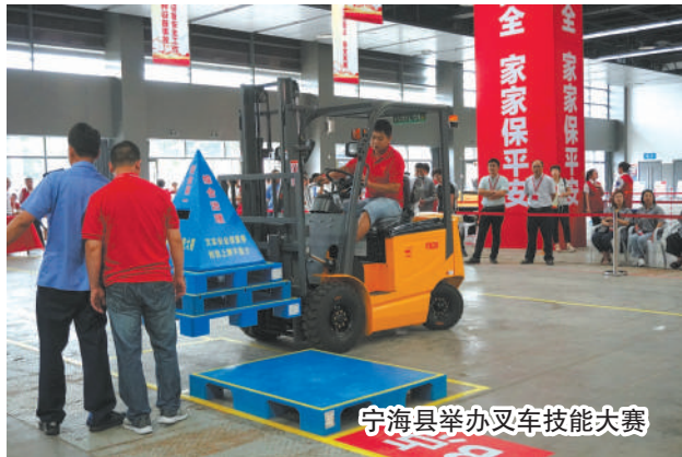
宁海县举办叉车技能大赛