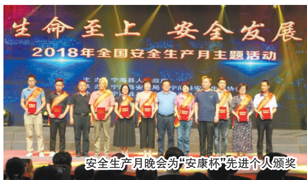
安全生产月晚会为“安康杯”先进个人颁奖

工培训网络管理模块，职工可根据自身需求在网上通过“点单式”报名参加各类技能素质等“点对点”培训项目，实现职工需求和工会服务有效对接，满足职工多样化学习需求。依托宁海本地区的模具、文具等龙头产业优势开展各类技能比武、岗位练兵等活动，促进企业职工素质提升，培育出了一大批工匠人才。