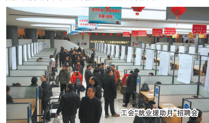
工会“就业援助月”招聘会

建立健全以法律援助律师和劳动争议调解室为内容的工会维权机制，妥善处理企业和职工关于收入分配、福利待遇、岗位晋升等方面的劳动争议。深入民营企业开展巡回普法、法制培训、纠纷化解等活动。加强工会劳动法律监督，健全劳动关系预警监测、劳动争议调处和职工群体性事件应急处置机制，有效预防和化解劳动争议，实现职工和企业“劳资双赢、共谋发展”。