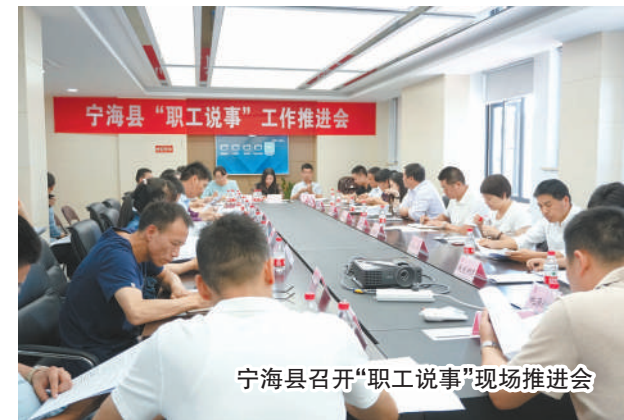
宁海县召开“职工说事”现场推进会