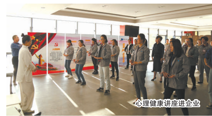
心理健康讲座进企业