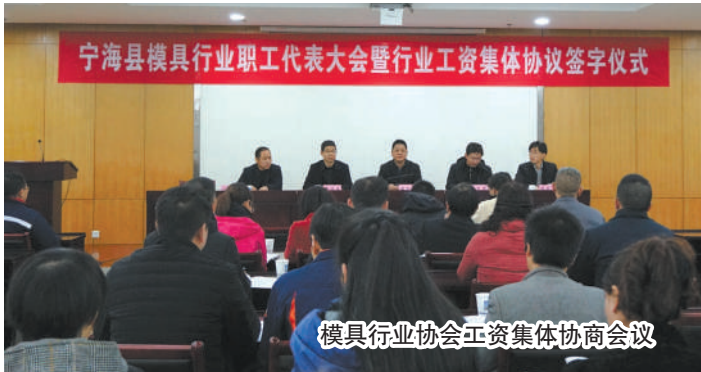
模具行业协会工资集体协商会议

当第一缕三月的和煦春风吹向大地，随之而来的还有工会“就业援助月”给职工心中带来的丝丝温暖。县城的人才交流市场、乡镇人口密集区域……随处可见工会组织的“就业援助月”招聘专场。