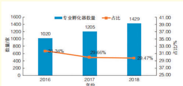
2016—2018年专业孵化器数量及占比