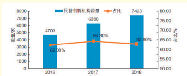
2016—2018年民营创孵机构数量及占比