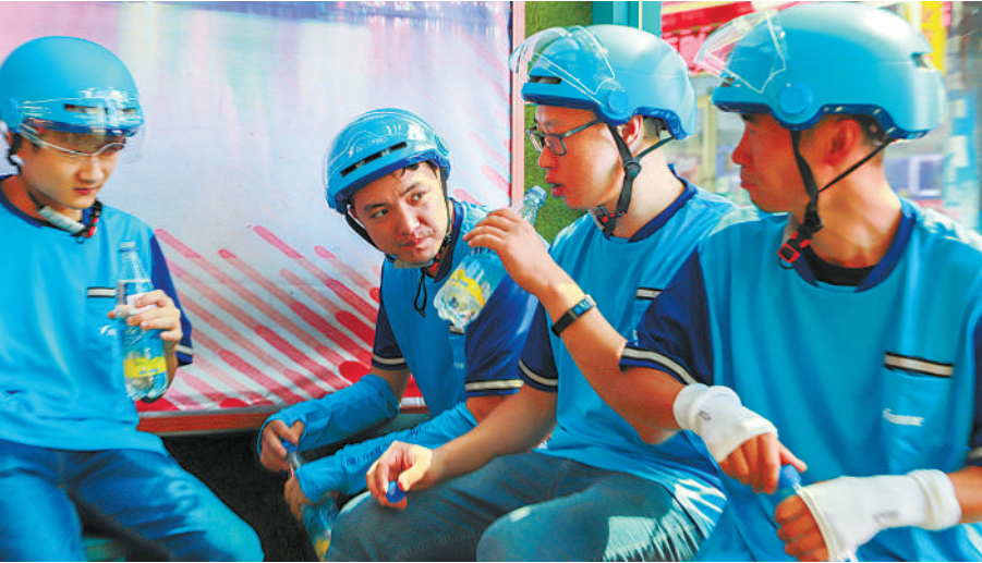
在职工服务驿站歇个脚，喝口水，成了外卖小哥的消暑方式。