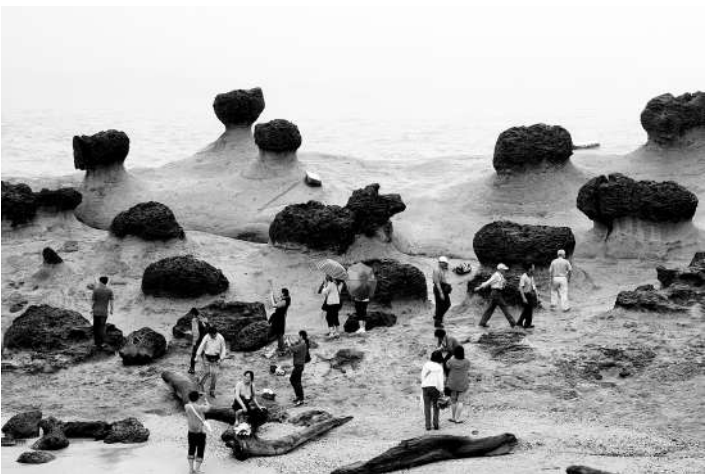
千姿百态的草状石吸引着各方游客。

如果到台湾旅游,我推荐大家别漏了到野柳地质公园一游。地质公园位于台北县万里乡,为大屯山余脉伸出海中的岬角,全长1700多米。从金山远眺,好像