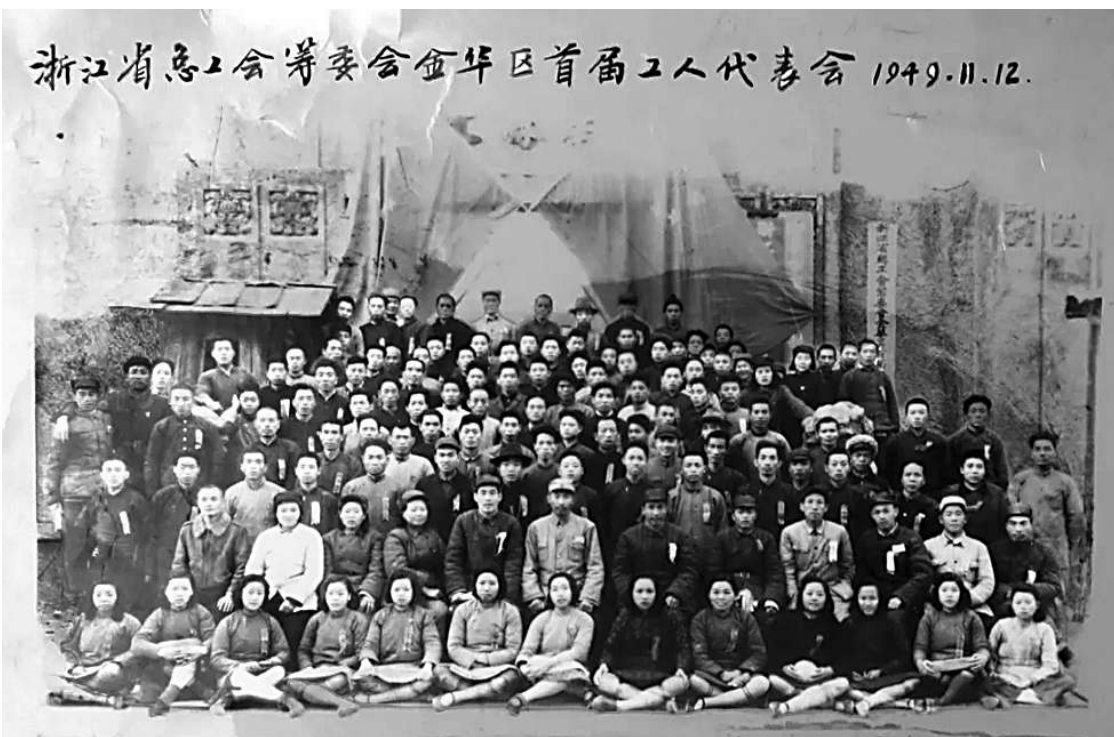
1949年11月,浙江省总工会筹委会金华区首届工人代表大会合影。

本报讯 记者羊荣江报道 10月,金华市总工会为庆祝新中国成立70周年精心推出了“金华工运展”,一个多月来,前往观展的职工络绎不绝。