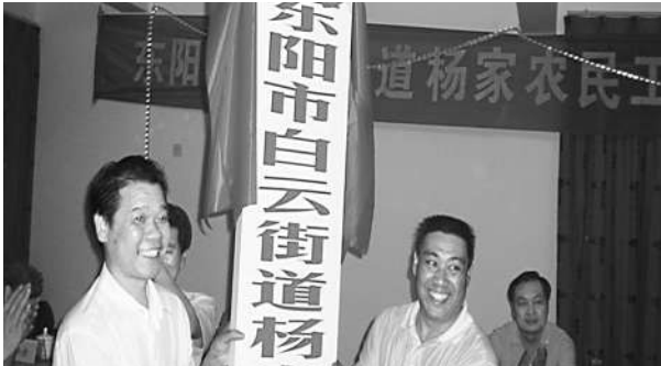
住地工会成立。二〇〇八年杨家农民工程