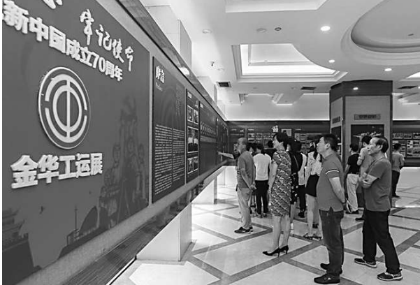
观看「金华工运展」的市民络绎不绝。