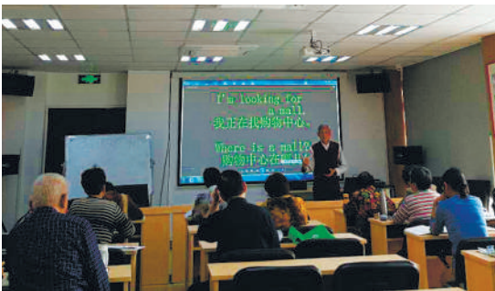
志愿者在为社区老人开展旅游英语培训。

位于杭州城区中心的拱墅区米市巷街道大塘巷社区作为全面推行养老服务“时间银行”模式的试点地区之一,如今半年多时间过去了,这里的实践情况怎么样了,日前记者进行了走访了解。