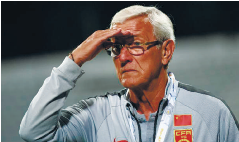
里皮困惑:中国国足的希望在哪? 新华社照片

新华社迪拜11月14日电 中国男子足球队主教练里皮14日在阿联酋迪拜宣布辞去主教练职务。当晚,国足在迪拜举行的一场2022年世界杯亚洲区预选赛预赛阶段(四十强赛)的关键比赛中以1:2负于叙利亚队。