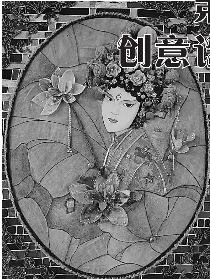
传统文化与当代生活相融合的拼布创意设计,彰显了我国进入新时代的文化自信。