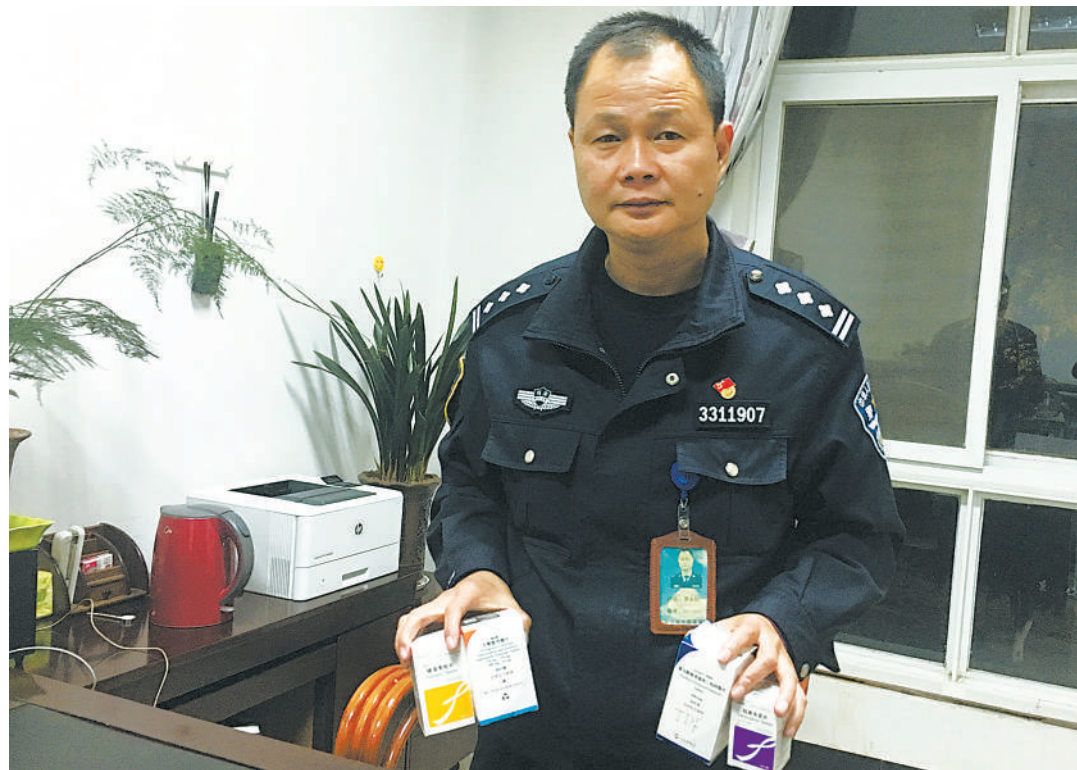
李警官手里拿着4瓶艾滋病阻断药等药品,他希望永远不要有用到的那一天。