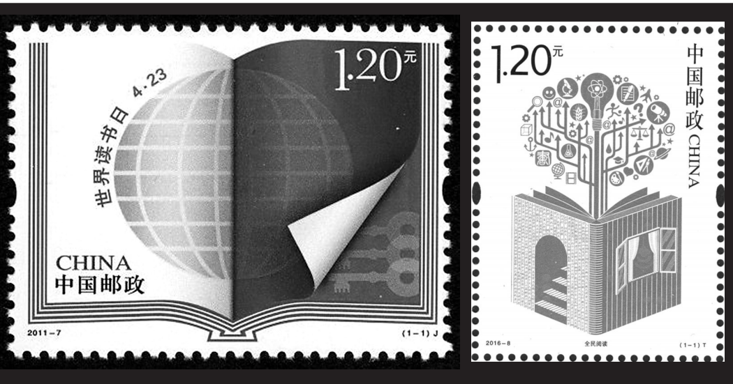
《世界读书日》纪念邮票。

《全民阅读》邮票主图是一本立起翻开的书籍,上部由一组向四面八方延展的线条,组成抽象的树状图形,树枝上结满了各种果实,显示知识带给人们的种种益处。书的左侧是一扇通向知识的大门,围绕阶梯微缩印制了《三字经》的部分内容。右侧是打开的窗户,表示通过读书,开启智慧之窗。邮票画面中印有“全民阅读”四字的盲文,展现了“阅读无障碍”的一个不能少的理念。邮票展现的内涵十分丰富,思想性和知识性都很强,极有欣赏价值和收藏价值。