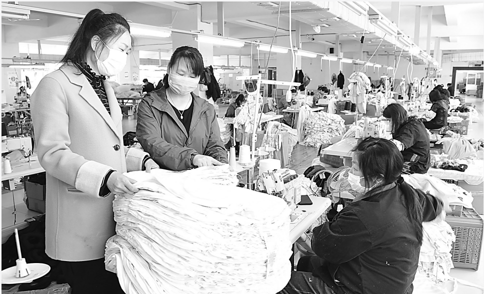
4月20日,在位于建德市莲花镇的美尔泰家纺有限公司的生产车间,170多名工人正忙于赶制出口美国的2000万元的婴儿应用家纺订单业务产品。自2月12日以来,作为建德市重点外贸企业,该公司一手抓新冠肺炎疫情防控,一手抓复工复产,每天组织员工加班加点,赶制婴儿应用家纺为主的外贸订单产品,力争在特殊时期仍有新突破。

优厚的大学生创业企业发展生态的背后,是西湖区全力打通大学生创业关键节点,积极契合企业和人才发展需求的不解努力。西湖区从创业指导、来杭落户、快捷政务、投资融资、职称评定、医疗保健、住房保障、配偶就业、子女入学等方面,为青年人才提供了快捷、优质、精准的服务。截至目前,全区累计创办大学生创业企业2020家,创业大学生