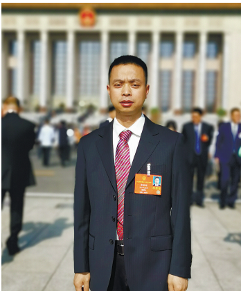
全国人大代表郑裕财