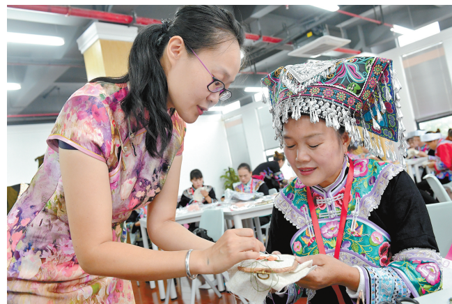
贵州册亨绣娘在宁波参加技能提升培训班学习。