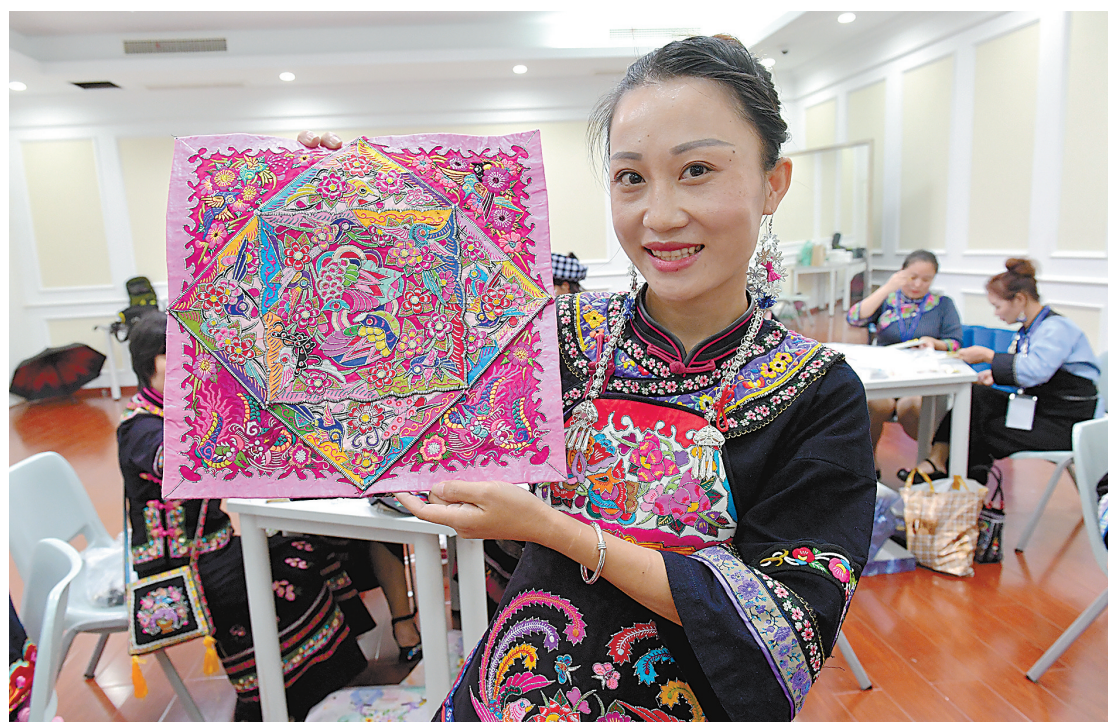
在浙江纺织服装职业技术学院学习的贵州绣娘在老师指点下拿出了自己满意的作品。

浙江纺织服装职业技术学院2012年开始对口帮扶贫困地区,至今,对口帮扶区域分布贵州、新疆、青海多地,是我国脱贫攻坚战中一支重要生力军。他们充分利用学校人才、技术和资源优势,不断拓宽贫困地区百姓的增收渠道,被当地百姓称为带来幸福的吉祥鸟——