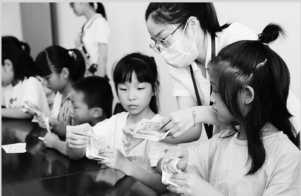
近日,玉环市龙溪镇第十三届“小候鸟”夏令营营员辅导班的20多名“小候鸟”走进台州银行玉环溪支行,跟着志愿者们一起学习点钞、存取款、假钞识别等金融理财知识,学当半天“小小银行家”。活动旨在培养“小候鸟”的储蓄、财富积累等理财观念和技能,帮助他们从小树立正确的消费观、人生价值观。