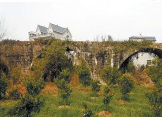
洞峰村的万安古桥