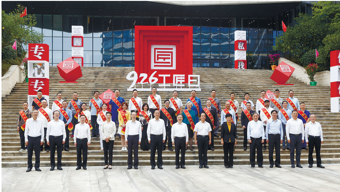
省、市领导与新晋“杭州工匠”合影,为大国工匠站台、喝彩。

牌,自今年5月第四届“杭州工匠”认定工作正式启动以来,认定工作领导小组秉持着“坚持高质量、坚持正能量、坚持强力量”的原则对“杭州工匠”进行认定,经推荐选拔和公示,并报市政府同意,最终产生了具有代表性的30名“杭州工匠”。