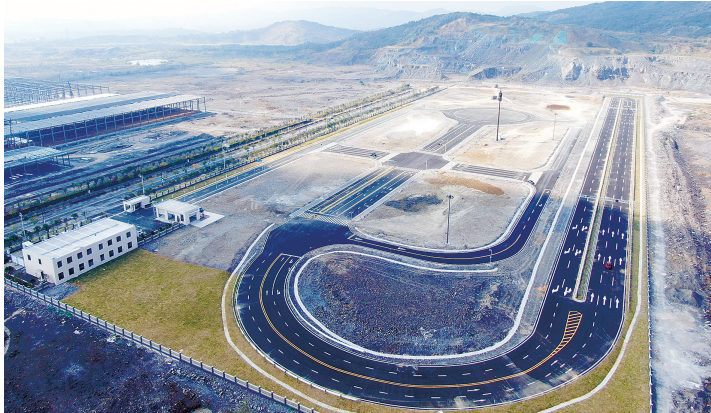
德清智慧出行测试场