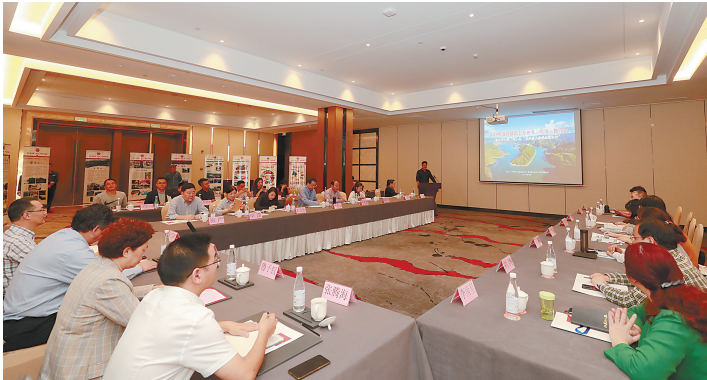
遂昌县职工疗休养(旅游)推介会现场。

今年是习近平总书记在浙江提出“绿水青山就是金山银山”理念的15年。一直以来,遂昌县县委县政府始终遵循习近平总书记“绿水青山就是金山银山,对丽水来说尤为如此”的嘱托,以打造“两山”样板为目标,全力推进“一城五区”生产力布局,推动工业、农业、现代服务业三产融合发展,大力推动县域高质量绿色发展,打造全国重点生态功能区样板、长三角知名休闲旅游目的地、浙