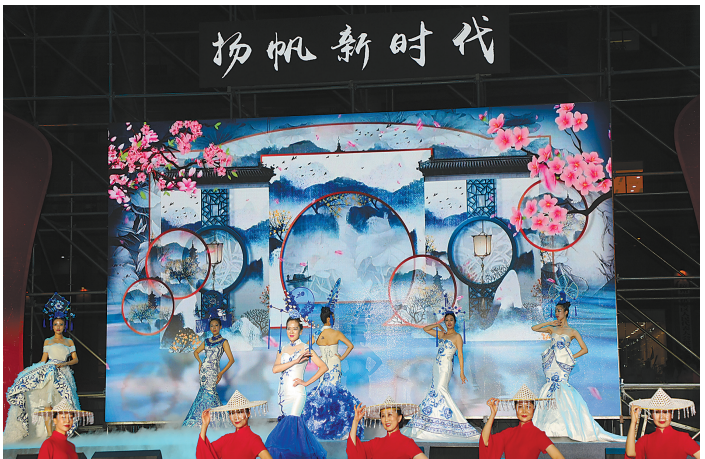
省直机关文体协会时装队表演时装走秀《东方魅力》。

9月25日晚,由省直机关工委、杭州市直机关工委、拱墅区直机关工委联合主办,省直机关工会和文体协会承办的“扬帆新时代”迎国庆晚会在杭州市拱墅区运河广场举行。省、市、区机