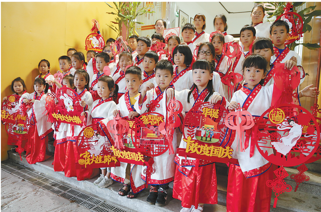
近日,玉环市龙溪镇塘厂文化礼堂唐风书院国学课上,小朋友们