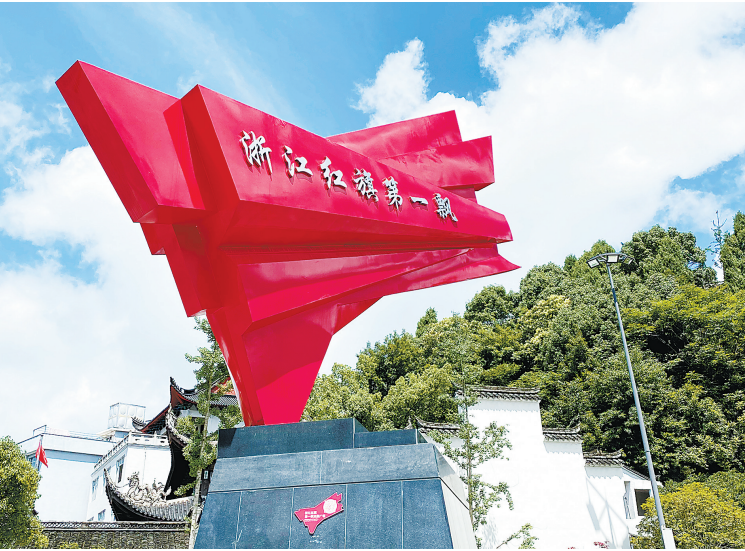
亭旁红色文化教育基地即景。

精心打造的亭旁红色文化教育基地,在给前来体验革命历程的党员干部,提供不忘初心的精神家园之余,还全力整合红色资源,挖掘红色故事,将绿色生态与红色资源有机融合,化红色元素为百姓增收致富的源头活水。