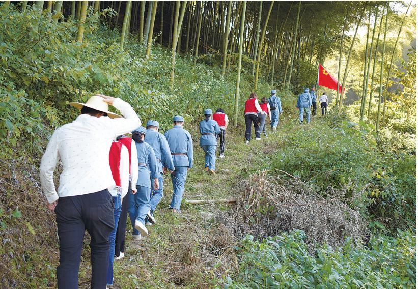
游人参与活动的场景。

这里坐拥浙西大竹海的自然风光，四面环山，茂林修竹，诗画梯田。这里森林覆盖率达65%以上，空气负