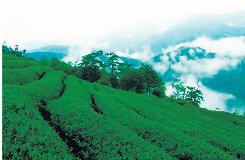
梅树底村秀丽风光。

位于梅树底景区的最高峰白菊尖，山高林密、气候宜人，常年云缠雾绕，非常适合茶树的种植与生长。深山