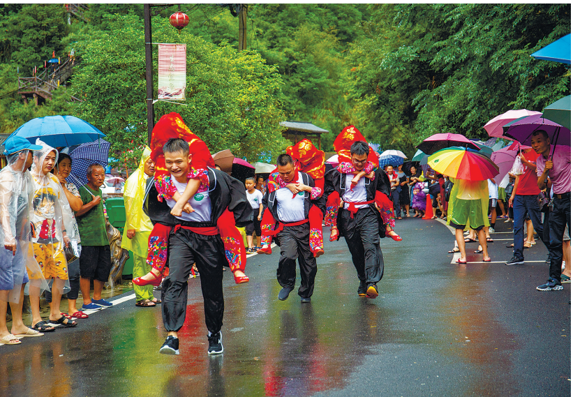
龙门村民俗活动即景。

完整，也是休闲养生的好去处。“百年古宗祠”鸣凤堂和溥源堂，内部建筑雕梁画栋，刻画精美。特别是鸣凤堂，曾是红军北上抗日先遣队红十军团的指挥部，是方志敏战斗过的地方。