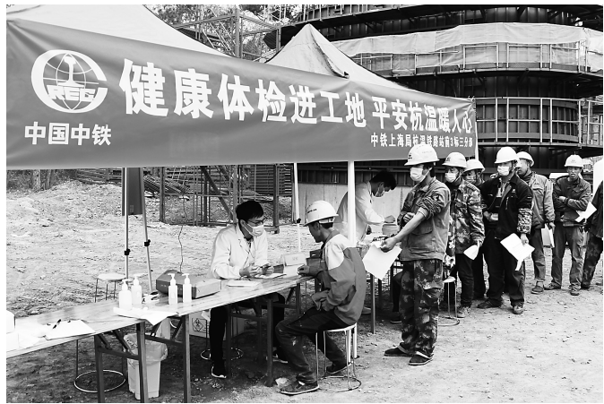
建筑工人排队准备体检。

本报讯 通讯员王俊清报道 近日,一辆大巴车开进了中铁上海工程局杭温铁路站前3标三分部仙居特大桥工地上,从车上下来了9名医护人员,搭起棚子,摆开仪器,快速有序地为来自“五湖四海”的农民工进行免费体检,建立健康档案,使农民工及时了解自己的身体健康状况,深受大家好评。