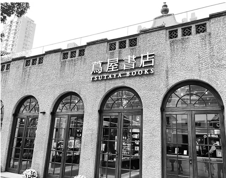
上海上生·新所茑屋书店。

茑屋书店为读者提供“生活方式的提案”,丰富了对传统意义上的书店作用的理解和认识,不仅拓宽了书店经营的范围,更对准了人们的精神文化需求。当书店之需成为人们的生活方式,书店,在城市生活中,在人们的精神和心灵中,就有了固守的位置。