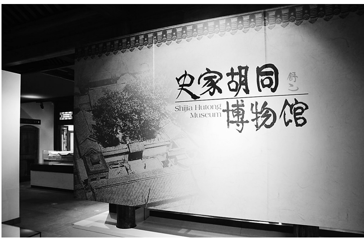
“一条胡同,半个中国”,说的就是史家胡同。

我家里还有盖着红章的《萧红小说全集》,上下两册。每当我翻开这两本书,就会回想起2017年冬天,我在呼兰河畔的感动和感慨。2017年1月,我去了萧红书里