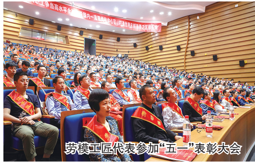
劳模工匠代表参加“五一”表彰大会