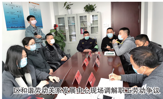
区和谐劳动关系发展中心现场调解职工劳动争议

健全企业民主协商机制;组织骨干力量,广泛调动企业职工参与热情;编织基地网络,和谐劳动关系形成和谐劳动关系工作三级网络,使“三治协同”的工会参与社会治理“江干模式”初显成效。