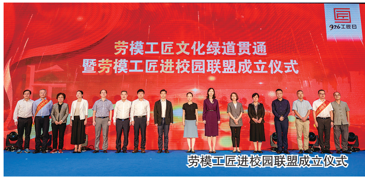
劳模工匠进校园联盟成立仪式

《执着坚守——做新时代的工匠》的讲座,用亲身经历讲述了劳模精神、劳动精神、工匠精神,让学生们感悟“幸福是奋斗出来的”。