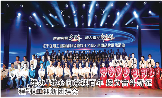
举办“我心向党迎百年 接力奋斗新征程”职工迎新团拜会