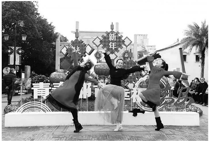
瑞安企业职工服务中心为职工送歌舞。