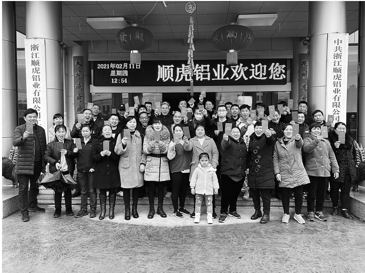
公司“留永”员工和家属在吃年夜饭领红包后合影。

作为一名工会“娘家人”,努力为职工解决实际需求,做实事、办好事,做最暖的工会人,是我努力的目标和方向。