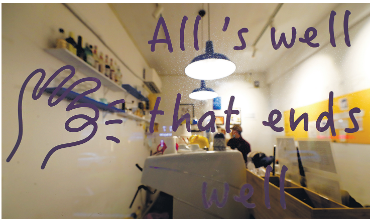
店门左手边玻璃窗上写着“All's well that ends well”,你知道这是什么意思吗?(答案可在本版寻找)