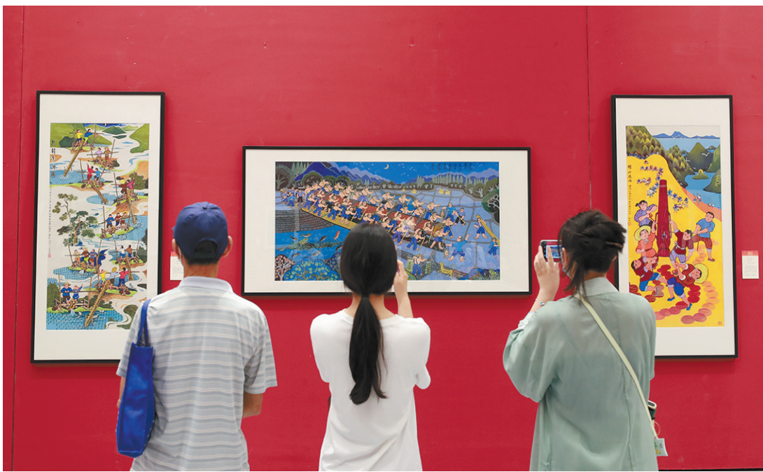
图为杭城市民正在观展。

种文化,种美好,种未来。8日上午,在省文化和旅游厅、省农业农村厅、省文学艺术界联合会指导下,由省美术家协会、衢州市委宣传部、衢州市柯城区人民政府主办的“感恩共产党 描绘新时代”庆祝