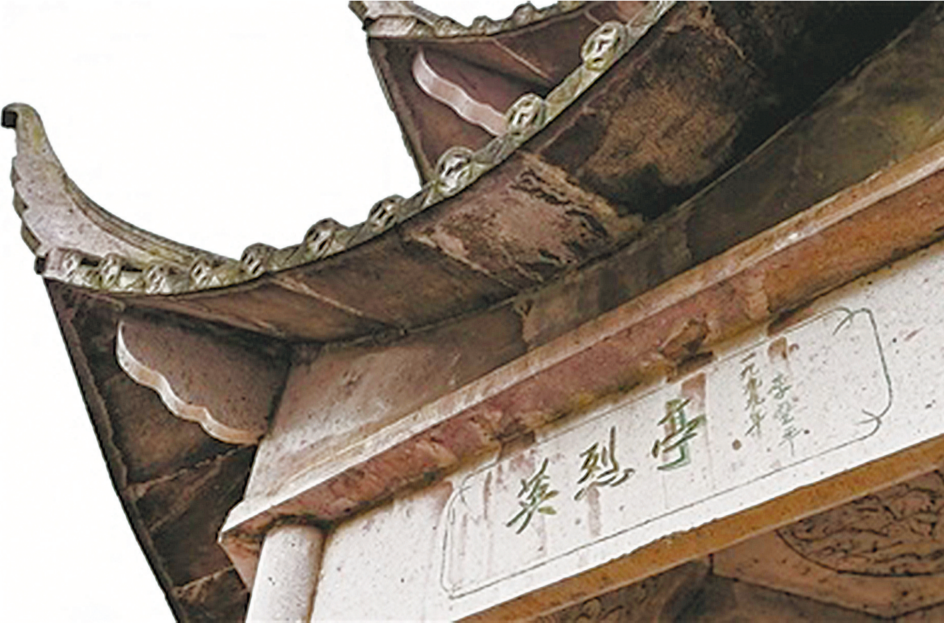
环山抗日英烈纪念馆(碑)

战火硝烟虽远,青砖黛瓦故景依旧。那些草木和故旧,那些音容和谈笑,从书中、照片里走出来,栩栩如生。