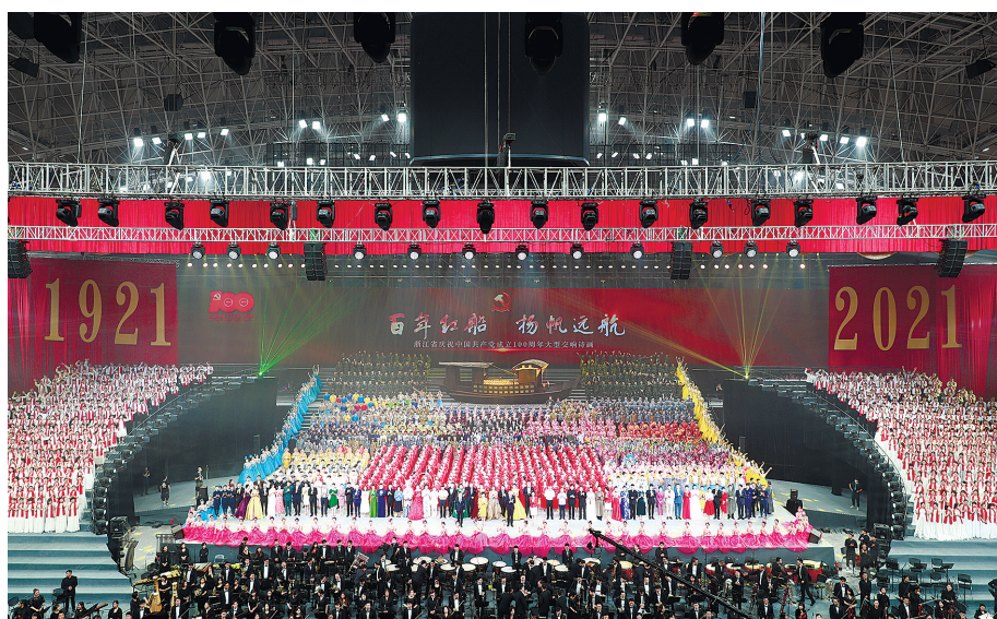
昨晚,浙江省庆祝中国共产党成立100周年大型交响诗画文艺演出举行。

袁家军说,浙江是中国革命红船起航地,是习近平新时代中国特色社会主义思想重要萌发地,“红色根脉”是党在浙江百年奋斗最鲜明的底色。100年来,浙江儿女在中国共产党的坚强领导下,筚路蓝缕、担当实干,特别是这些年来,浙江坚持一张蓝图绘到底,坚定不移沿着“八八战略”指引