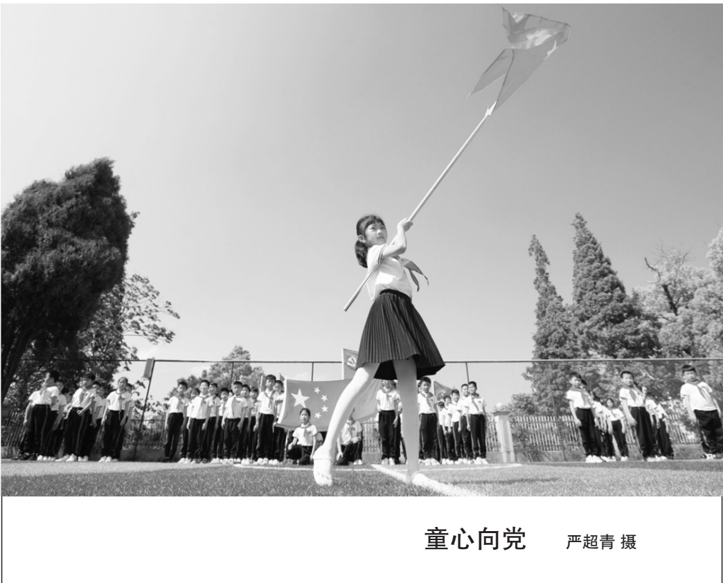
童心向党