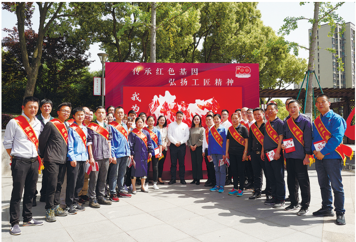
姜山镇“最美产业工人”颁奖现场。

作为鄞州区传统工业强镇和农业大镇,姜山镇共计有3000多家企业和4万余名职工分布在59个村社中。如何运用有限的资源把基层工会工作全方位覆盖下去,是姜山镇深化非公企业产业