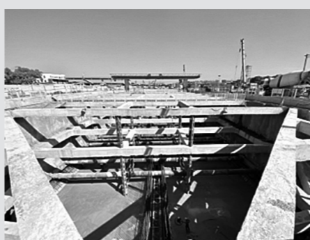
本次浇筑的首块底板长25m、宽36m、厚1.6m,混凝土浇筑面积约900平方米,浇筑量约1540立方米。

日前,浙江省交通集团杭绍甬高速杭绍段项目南阳隧道L基坑第一块底板浇筑完成,拉开了主体结构施工序幕。