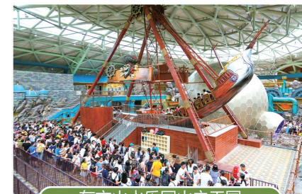
东方山水乐园山之王国