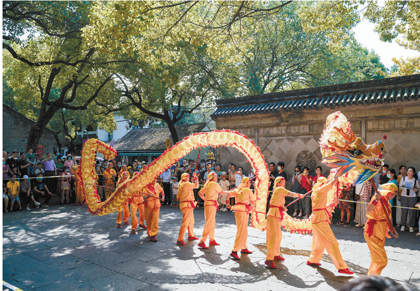
■通讯员王雪珍/文

作为江南地区唯一保存较为完整的古县城,宁波慈城是中国民族优秀建筑文化遗产和旅游目的地,国家4A级旅游景区。2009年,荣获联合国教科文组织亚太地区文化遗产保护荣誉奖。 自2020年10月入选首批浙江省职工疗休养基地以来,慈城持续挖掘悠远厚重的气质,用国风国潮的活动弘扬和发展传统文化的风采与魅力,不断提升服务质量、开发旅游产品、组织景区活动,努力构建可满足文化交汇、交流,以及文化商品创意、创新、创造、生产、展示、销售的产业生态。