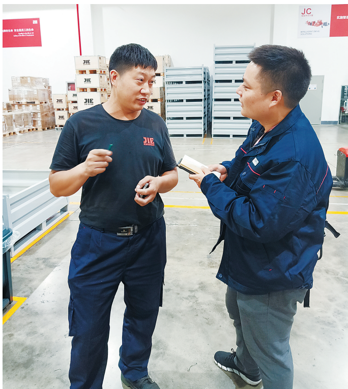
记者(右)在车间走访工友。

“挺后悔的,没有挤出时间去参加‘五员合一’培训班。”再一次见面,谈起过去一年的变