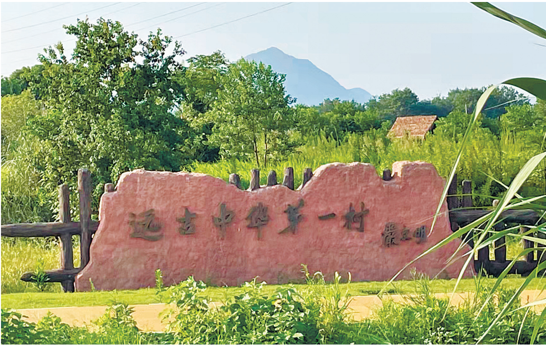
浦江上山文化遗址被誉为“远古中华第一村”

田野荒郊是他们的办公室,废墟残垣是他们的作业本,日夜星辰是他们追逐历史的见证者。考古工作的意义,在于为人们创造一条通往过去的时光隧道,让人们看到废墟的眼泪和时代的伤口,更看到文化的繁荣和文明的延绵。