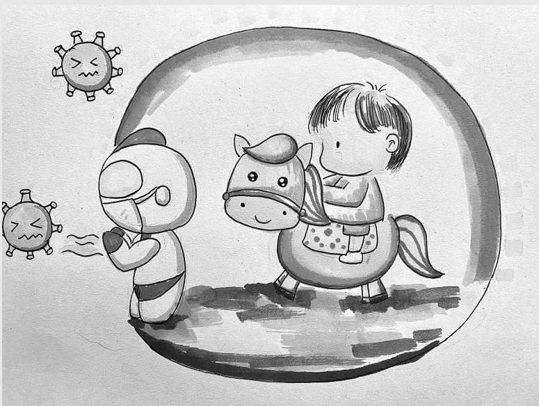
打跑病毒，保护“绿码”。

近日，杭州市绿洲花园幼儿园工会的教师们以画为媒，原创系列漫画《“绿伢儿”大战新冠病毒》，用通俗易懂的动漫形象，告诉孩子们面对疫情应该如何保护好自己，一起来看看吧！