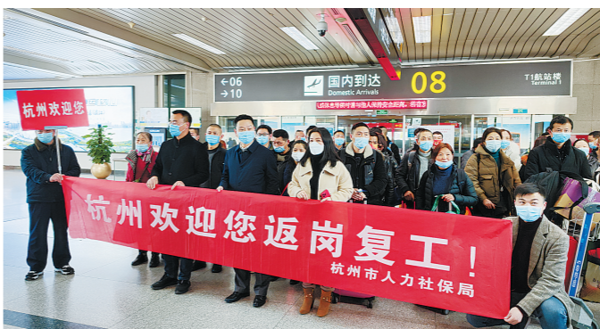
广元籍来浙返岗人员乘专机到达杭州机场。

2021年调整对口帮扶结对关系后,杭州市与四川广元市结对,建立东西部协作关系,两地常态化劳务协作工作机制逐步完善。春节期间,杭州市与广元市人社部门密切协作,通过走访慰问、电话访谈等方式提前摸