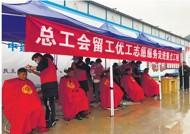
劳模工匠在东钱湖宁波国际会议中心项目工地进行志愿服务。

劳模工匠在广大群众中具有极高的影响力和号召力。为推动劳模工匠积极投身宁波经济社会建设实践，2020年围绕贯彻落实习近平总书记