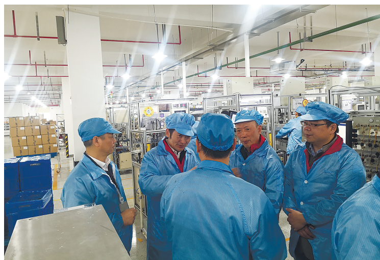
劳模工匠在鄞州宁波精华电子科技有限公司进行技术帮扶。