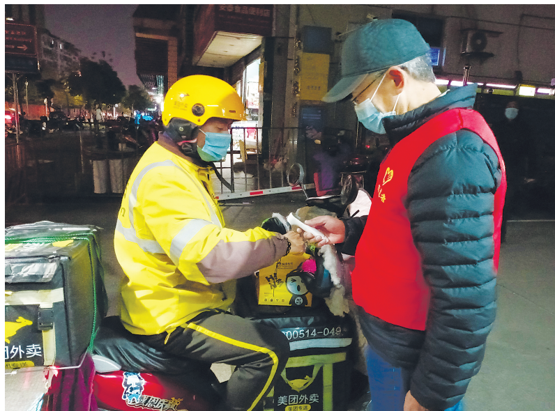
劳模工匠参与抗疫。