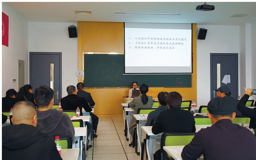
协会组织劳模先进学习党的十九届六中全会精神。

宁波市劳模工匠协会始终着力于打造有温度的“劳模之家”，不断探索和健全劳模工匠管理服务工作机制，每年组织开展劳模工匠基本情况常规普查，查漏补缺、巩固成果，完善充实劳模工匠数据库，动态精准掌握劳模工匠数据，促进日常管理规范化。截至目前，协会完成全市2293名市级以上劳模情况调查。