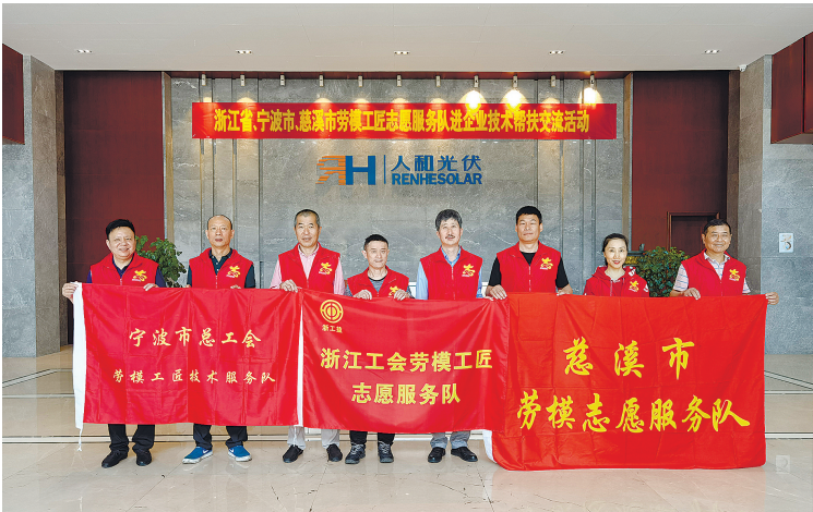
劳模工匠在“人和光伏”进行技术帮扶。

此外，宁波市劳模工匠协会常态化开展“名师带徒”活动，充分发挥各级高技能人才帮带作用，目前全市完成师徒带徒2900多对；配合开展第七批宁波市劳模工匠创新工作室申报命名和第一轮市级劳模创新工作室复评工作，共命名市级示范性劳模工匠创新工作室8家；市级劳模工匠创新工作室27家，并协助完成第一轮市级劳模创新工作室复评73家，推荐申报省级11家，以劳模工匠的创新创效活动带动职工群众整体提升。