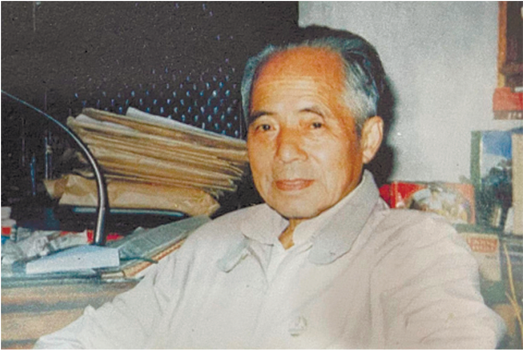
张包子俊先生在办公室

邮票作为一种历史与文化的载体,充分展现了一个国家的政治、经济、科技、文化进步和发展的成就。今年2月7日,是已故中华全国集邮联合会副会长、新光邮票研究会创始人、中国集邮界先驱张包子俊先生诞辰120周年,多年来,我陆续收藏了一些他的签名封、信札、题词、资料等,并进行研究,从中了解到这位杭州先贤集邮的漫长经历和一些感人往事。