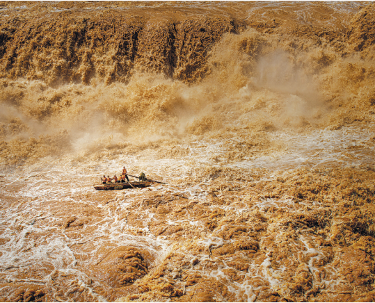
《黄河纤夫》