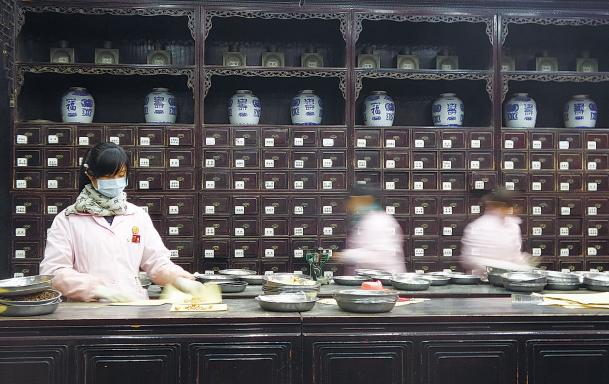
《老字号里的国药馆》