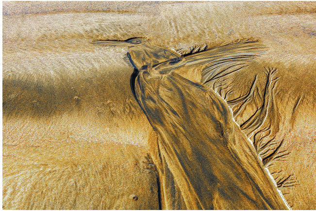
《枯树昏鸦》