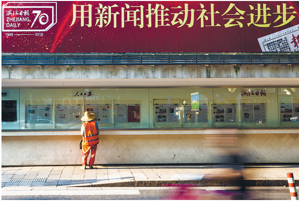
《共同进步》