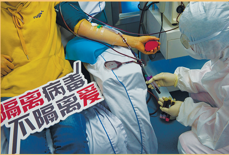
《隔离病毒,不隔离爱》