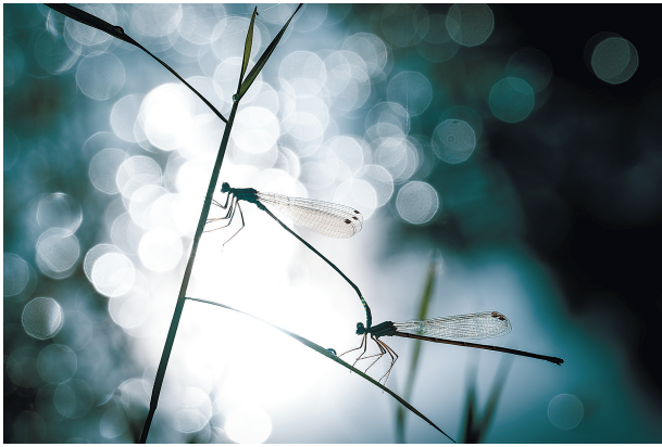
《斑驳的晨阳下》