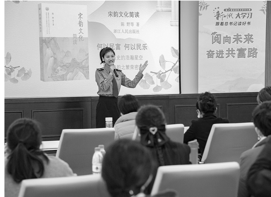
省直机关讲书大赛现场。

域,每期主题不同,邀请的分享嘉宾风格各异。每次活动,不仅激发职工的思考,更让人感受到了文化的力量。