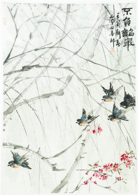
《不负韶华》田舍郎 绘

共同富裕既要富“口袋”,也要富“脑袋”,为了让更多的职工群众能欣赏到这些精品画作,4月13日起,“西湖政协”微信公众号分三期展示了参展作品,邀请您云观展、云欣赏,以更好地为助力助推共同富裕示范区首善之区建设贡献智慧和力量。