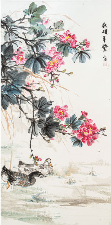
《秋硕果丰》陈小国 绘