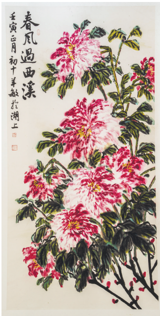
《春风过西溪》羊敏 绘