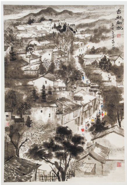
《古村新貌》宁臻红 绘