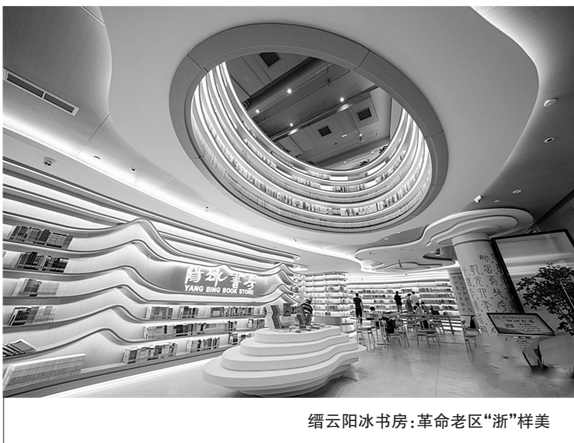
缙云冰书房:革命老区“浙”样美