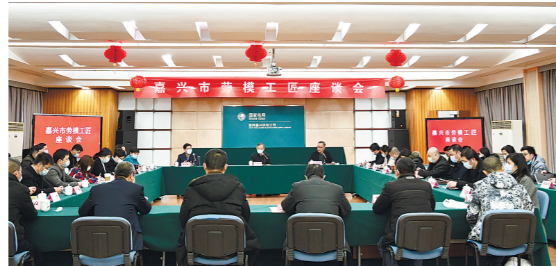
创新工作室负责人参加劳模工匠座谈会。