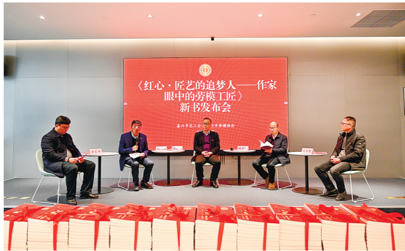
《红心·工匠的追梦人——作家眼中的劳模工匠》新书发布会。