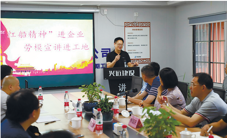
“红船精神”进企业、劳模宣讲进工地活动。

花开满园，香溢四方。两年来，“红船精神”进企业宣讲团进企业、入车间、赴园区、到工地，宣传宣讲党的创新理论，传播工会声音，讲好职工故事，引导广大产业工人用“红船精神”塑“心”立“行”，现已开展宣讲、座谈、学习会等形式活动435场，现场参与职工5.7万人，凝聚起了奋进新时代的磅礴力量。在网上职工之家平台开展“我心向党·红船精神进企业”学习答题拉力赛，点击浏览量超过11.8万，建立活动小组80余个，吸引1.1万人次每天参与，微信端推出“学党史 感党恩 跟党走”党史上的今天”专栏，累计阅读量超过15万人次。“红船精神”进企业主题教育实践活动于2020年入选浙江省工会改革创新项目库，在全国总工会、中央网信办联合举办的“网聚职工正能量争做中国好网民”主题活动中获三等奖，在“我心向党”全省职工思想政治教育工作优秀案例展评中获二等奖。