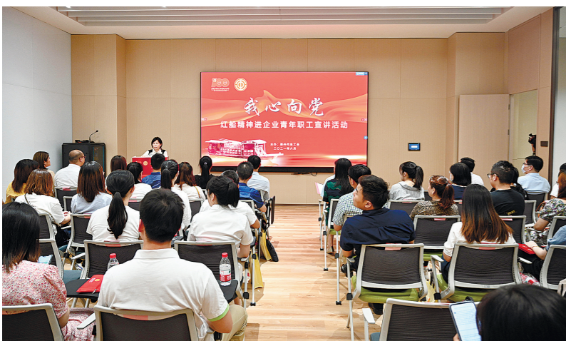
“我心向党”红船精神进企业青年职工宣讲活动。

匠宣讲团。2021年，遴选45位优秀青年职工组建嘉兴市青年职工宣讲团，充实完善“红船精神”进企业宣讲团师资力量，形成了覆盖各行各业、各个年龄段、全市各个地域的庞大的“红船精神”进企业宣讲教育的中坚力量。