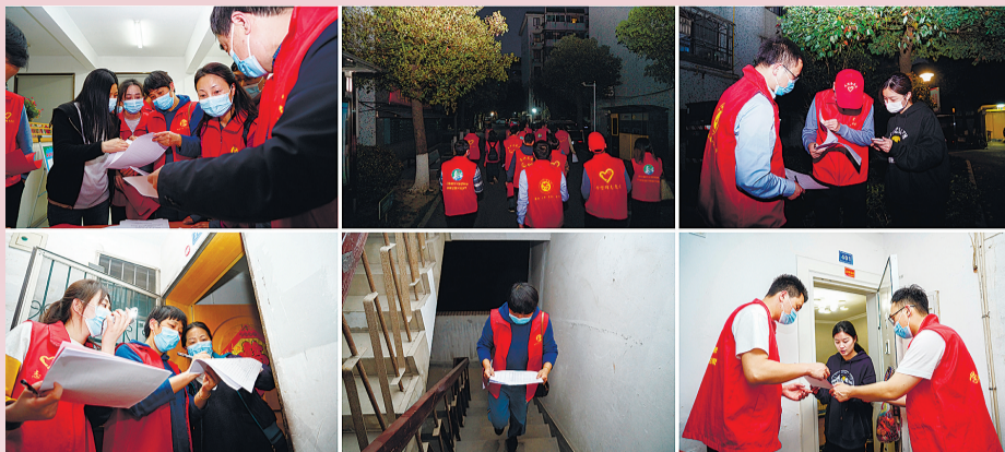
《“洗楼”进行时》