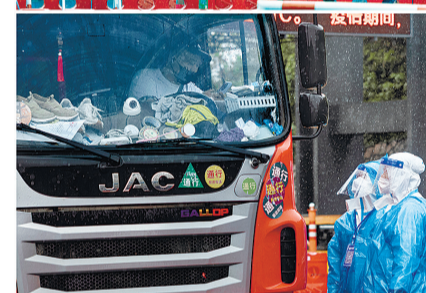
《风雨中的坚守》