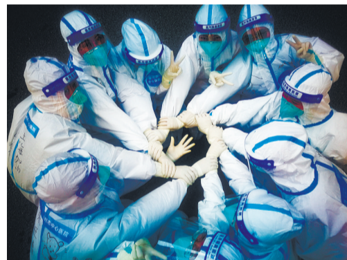
《万众一心》