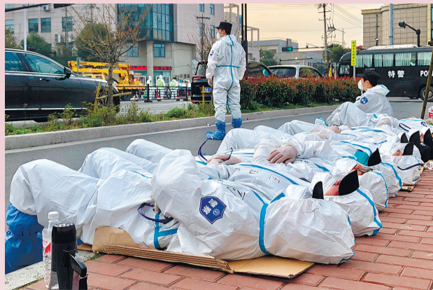
《就地充电》

《万众一心》《“疫”不容辞》《风雨中的坚守》……本次职工公益摄影展以防控、抗击新冠肺炎疫情为主题,用优秀的文艺作品向奋战在抗击疫情第一线的全体人员表示崇高的敬意,同时以别样的劳动画面向党的二十大献礼。