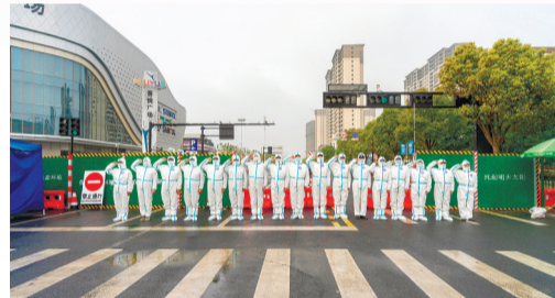
《“疫”不容辞》