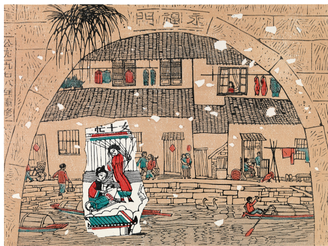
《悠悠岁月之《女十忙》

人物借助光影进行了黑白灰处理,体现出前后主次关系,灰色部分的肌肉、衣褶丰满了人物厚度,丰富了画面细节,强化了人物力量,体现了画家扎实的深厚的写实功底。太阳与云雨很好地烘托了日晒雨淋的氛围,暗示着不畏艰辛的石工精神。