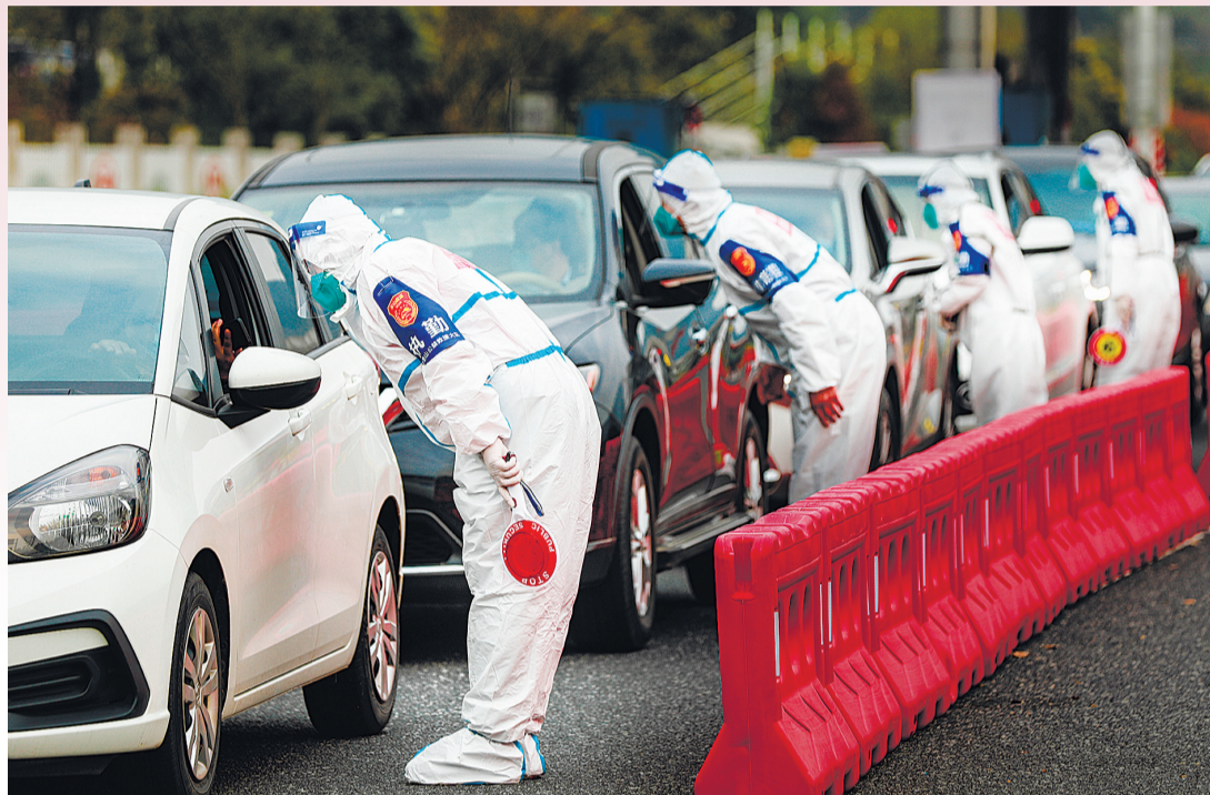
《一丝不苟》