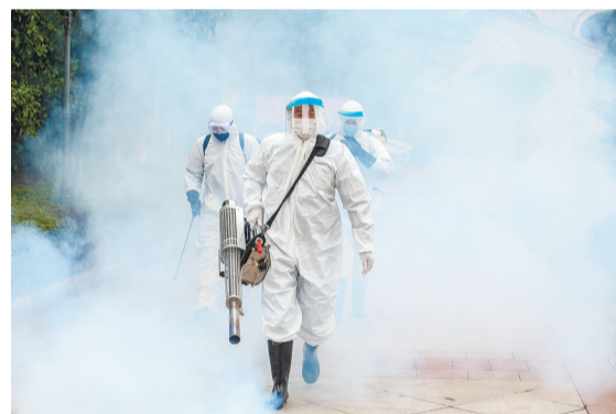
《疫情防控,消毒先行》