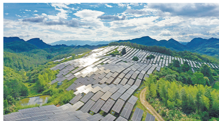
昨日,鸟瞰仙居县上张乡一山坡上光伏发电站,一排排蓝色的光伏发电设备正在运行。近年来,仙居县充分利用荒山坡地,发展光伏、风力发电等清洁能源,带动农民增收,赋能乡村振兴。