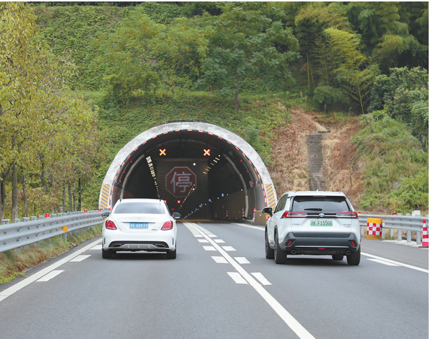
大梁山隧道入口的“水幕”标志。

本报讯 记者金钧胤报道 近日,浙江省交通集团丽水管理中心在G1513温丽高速大梁山隧道入口安装了一种新型的“水幕”标志,在隧道内火灾等应急事件发生时,水幕显示出“停”字以控制车辆进入隧道,这标志着省内首套柔性拦截警示系统正式落户丽水。 以往,当隧道内发生紧急事件时,通过情报板发送隧道交通封闭信息,然后再由监控室远程操作下放护栏,进行隧道交通封闭,防止二次事故的发生。柔性水幕警示系统,启动时间只需10~15秒,能快速显示,清晰度高,对于司乘人员自动预留时间足,不易对车辆