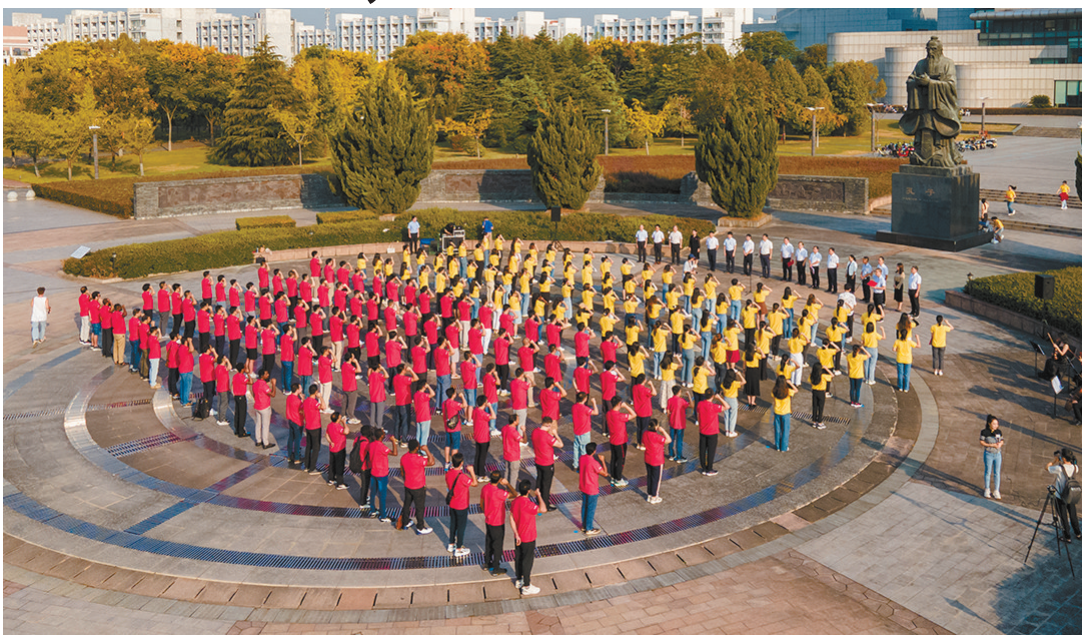
昨日,浙江师范大学崇师广场孔子像前,260余名新进教师庄严宣誓入职,迈向新岗位。