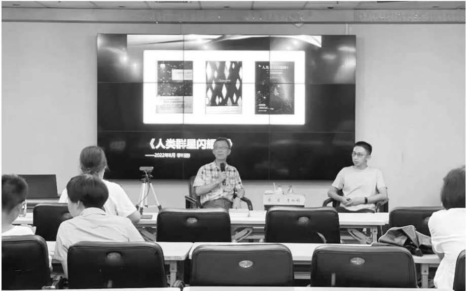
文澜读书岛今年的第17期阅读分享会分享奥地利作家斯蒂芬·茨威格的《人类群星闪耀时》，书友观点碰撞，把书读得既活且深。